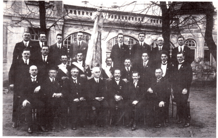
Der Vorstand des Langenhorner Gesangvereins vor der „Harmonie“ (Stiftungsfest 1910).

hundert Sänger von Bass und Tenor angewachsen. 1910, als der Verein sein 44stes Stiftungsfest feierte, waren allein vierundzwanzig Herren im Vorstand!