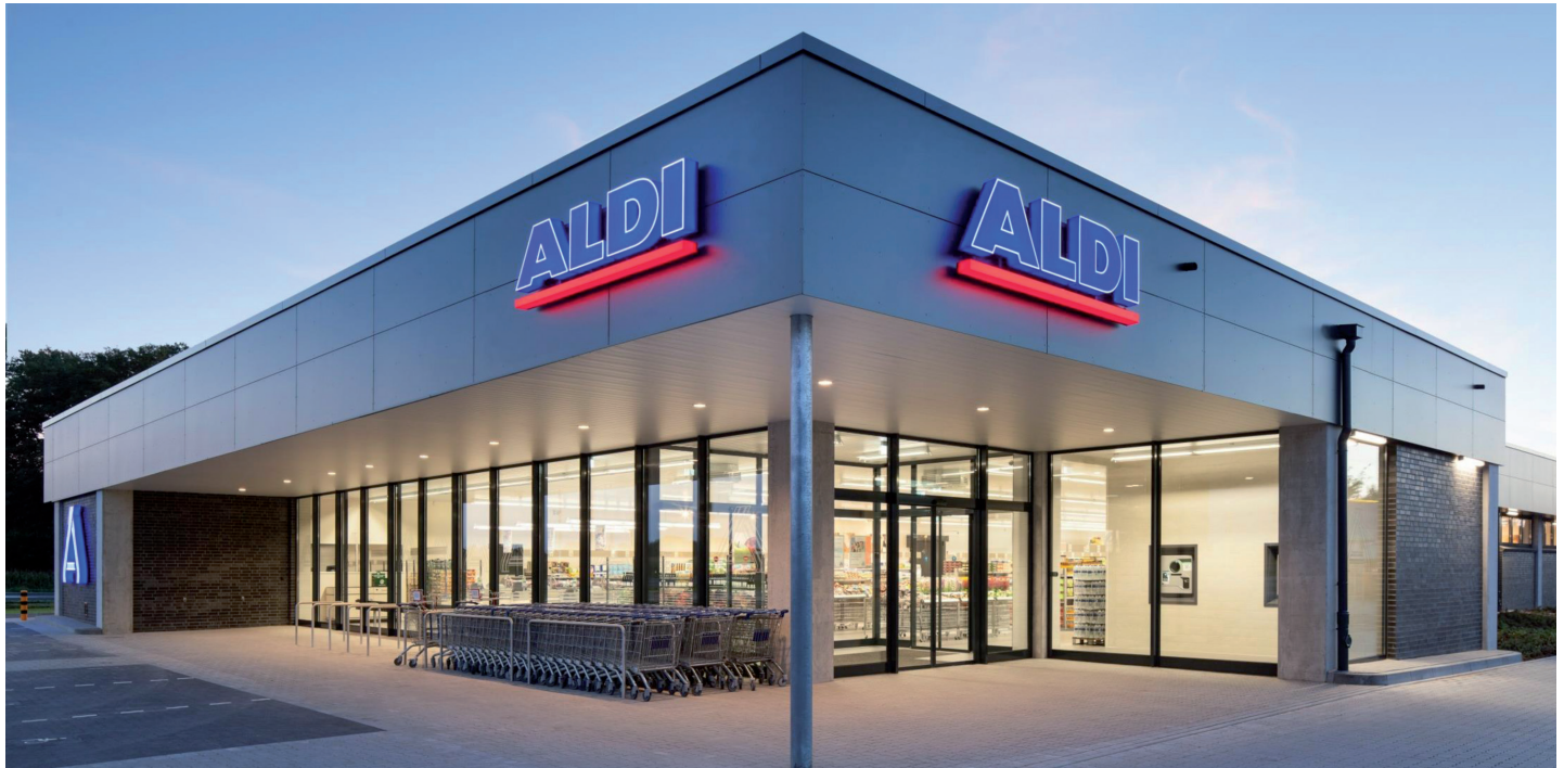
Prototyp einer neuen Aldi-Filiale

Der Stadtteilrat Essener Straße war im Oktober so gut besucht wie schon lange nicht mehr. Aldi stellte die Pläne für jene Filiale vor, die ab Jahresende 2017 auf dem ehemaligen Hotel-Tomfort-Gelände eröffnen soll. Aber auch sonst lohnt sich ein Einblick in die Arbeit des Stadtteilrats.