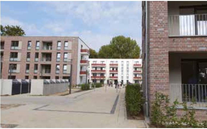
Flüchtlingsunterkunft mit der Perspektive Wohnen (UPW)