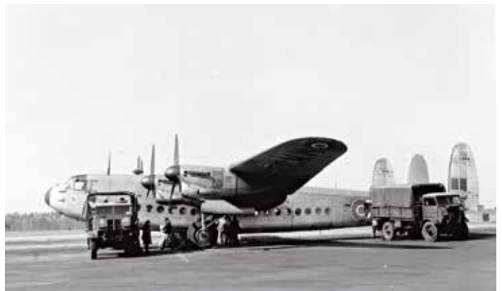
Während der Berliner Luftbrücke von Juni 1948 bis Mai 1949 war Hamburg Airport einer der Startflughäfen der Rosinenbomber.

Um den neuen Passagier-Jets gerecht zu werden, verlängerte der Flughafen seine Start- und Landebahnen. Damit wurde das Gelände in den 1960er Jahren auf rund 500 Hektar vergrößert – eine Größe, die bis heute nahezu unverändert geblieben ist. Die Passagierzahlen hingegen erreichten immer neue Höhen. Denn seit dem Ende des Zweiten Weltkriegs boomte die Luftfahrt: 1951 reisten fast 212.000 Menschen über den Hamburger Flughafen, 1961 wurde erstmals die Millionen-Grenze überschritten.