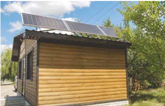
Solaranlage im Kleingartenhaus

Der Strombedarf wird erheblich zunehmen (von 560 auf 715 Terrawattstunden in 8 Jahren). Zudem wird davon bisher nur 42,3 % von erneuerbaren Energien produziert (240 TWH je