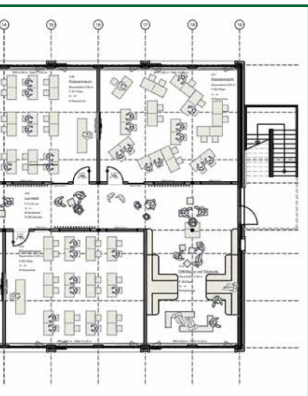
Bild links: Die neue Schule (Präsentation Fr. Renner). Unten: Altes Schulschild (Archiv)