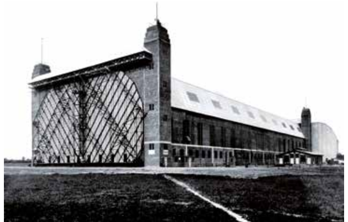
Luftschiffhalle in Hamburg: Die Luftschiffhalle in Hamburg wird 1912 nach einem Jahr Bauzeit eingeweiht. Sie konnte zwei Zeppeline aufnehmen.

Die Langenhorner Rundschau (bzw. ihr Vorgänger „Heimatblatt“) begleitete den Aufstieg seit 1957. Die Debatten, ob „Düsenflugzeuge“ den innerstädtischen Flughafen anfliegen dürfen wurde hier heiss erörtert, schon bald verbunden mit der Frage, ob nicht in Kaltenkirchen ein besserer Standort für einen „Düsenflughafen“ sei.