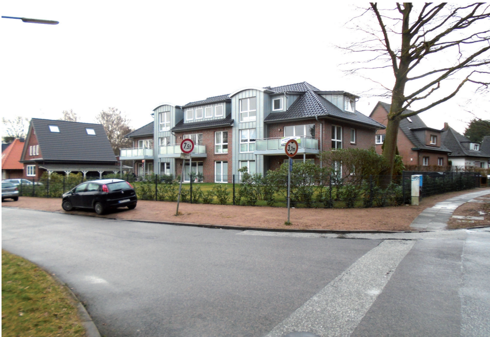
Da wundern sich die Nachbarn: Bild von der Straßenecke Fibigerstraße/Fosberger Moor - ein Gebäude mit 9 Wohnungen in einem Einzelhausgebiet.