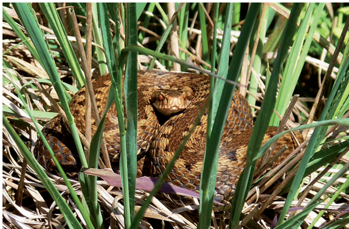
Kreuzotter, Foto M. Braasch

Sie ist in gewissermaßen offizieller Mission unterwegs, denn das Bezirksamt Nord hat mit der Schutzgemeinschaft Deutscher Wald (SDW) und dem NABU Hamburg einen Betreuungsvertrag für das Raakmoor abgeschlossen und einen Pflege- und Entwicklungsplan erstellt, der Grundlage für alle Arbeiten im Naturschutzgebiet ist. Das ca 35 ha große Raakmoor ist ein wichtiger Lebensraum für seltene Pflanzen sowie geschützte Tierarten und soll deshalb nicht nur erhalten, sondern auch weiterentwickelt werden.