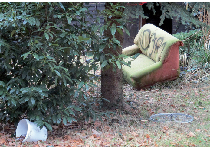
am 3. März 2017