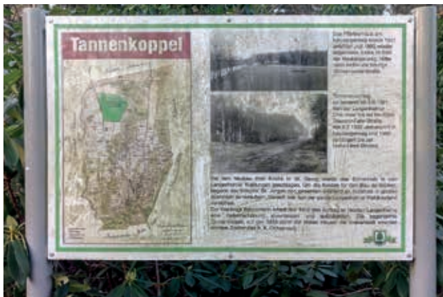
Eine Info-Tafel von E. Möller

Oder Sie besuchen uns in der Werkstatt an einem Donnerstag bei der Offenen Tür (16–18 Uhr) und sehen, wie wir vorankommen.