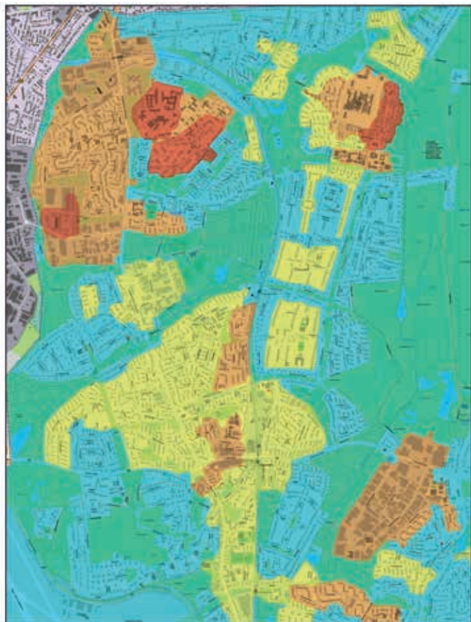
Ausschnitt aus: Wärmenetzeignungskarte, www.geoportal-hamburg.de

Der überwiegende Teil Langenhorns ist wenig geeignet bis