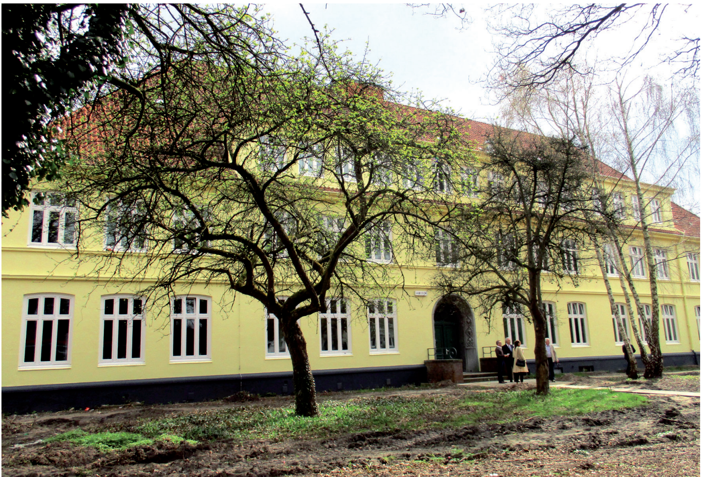
Blick auf die renovierte Süderschule. Das hier sichtbare Portal ist seit dem Umbau außer Betrieb, der Eingang (und die Adresse) sind jetzt Tannenweg 11

Der „Tag der offenen Tür“, den die Hausleitung am 4. Juni zwischen 14 und 18 Uhr veranstaltet, ist die beste Gelegenheit für einen guten Start! Sie sollten die Chance nutzen: Einige, um ihre alte Schule wiederzusehen - alle anderen, um etwas Neues im Stadtteil zu beginnen!