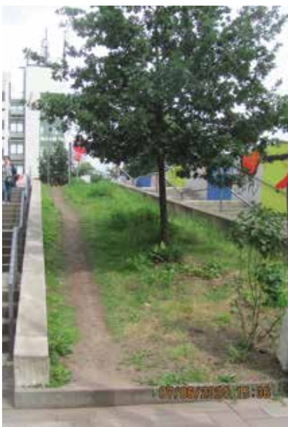
Einmalig 2015 gärtnerisch hergestellter Grünstreifen am Langenhorner Markt