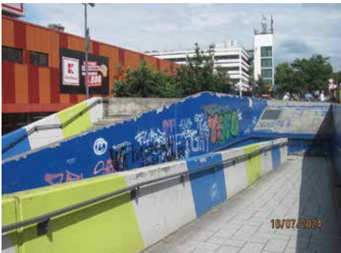
Zuletzt 2016 neu bemalte Fußgängerrampe am Langenhorn Markt