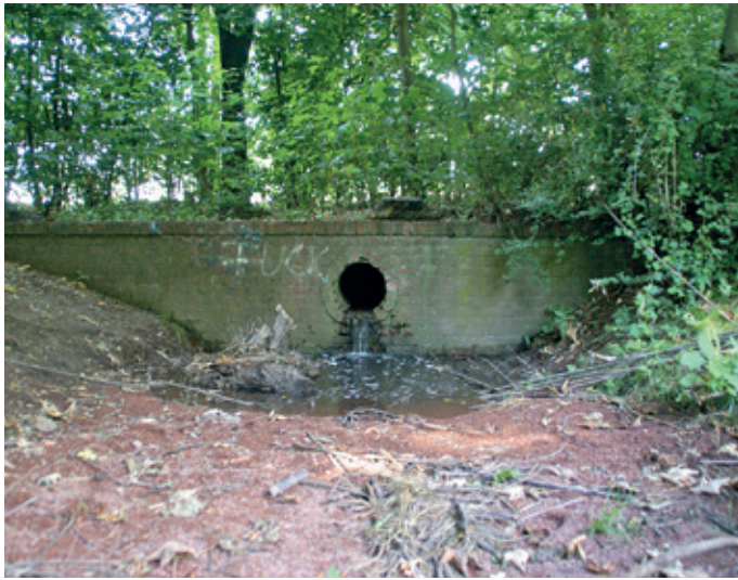
Zufluss aus Norderstedt

Wir starteten in der Texas- und Mau-Mau-Siedlung, wo der Born heutzutage aus Norderstedt nach Hamburg fließt. Das war nicht immer so, aber dazu später.