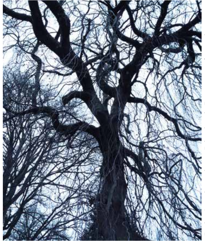
Es gibt in Langenhorn noch einige Eichen, die in der Franzosenzeit gepflanzt wurden.

„Aber Wachstum ist ein Naturgesetz“, wird mir entgegengehalten. Überlegen Sie selbst: Wieviel wachsen Sie im Jahr, seit Sie „erwachsen“ sind? In der Biologie hat alles und jedes seine Größe - nichts kann über Jahrhunderte unendlich weiterwachsen. Und: Von Natur aus ist alles Wachsen zwingend mit Vergehen verbunden. Ja, jährlich wachsen Millionen Tonnen von Laub, von Früchten, wachsen Tiere aller Art heran. Aber sie alle haben eine begrenzte Zeit - dann vergehen und verschwinden sie, die Natur wirkt in Kreisläufen. Dass etwas immer weiter nur wächst ist eine ideologische, von Menschen