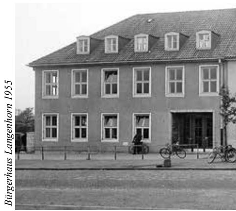
Bürgerhaus Langenhorn 1955

Weiter oben schrieb ich, dass wir in den letzten Jahren Tausende von neuen Einwohnern in Langenhorn hinzubekommen haben – aber zum Ankommen bedarf es mehr als Wohnungen und ein Einkaufszentrum! Wir brauchen öffentliche und für alle zugängliche Räume für Kultur, für