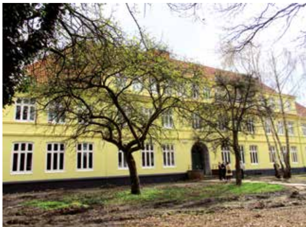
Integration in Langenhorn: Die Süderschule zeigt, wie es geht.

In Bezug auf den Sozialen Zusammenhalt im Bezirk verwundert das Fehlen eines jeglichen Bezugs auf das 2017 neu aufgelegte Hamburger Integrationskonzept „Wir in Hamburg“ für Teilhabe, Interkulturelle Öffnung und Zusammenarbeit. Auch an ein bezirkliches Integrationskonzept, so wie im Bezirk Altona schon seit 2011 existent, ist im Bezirk Hamburg-Nord offenbar nicht gedacht. Im Bezirk Hamburg-Nord ist der Stadtteil Langenhorn nach Dulsberg und Hohenfeld der Stadtteil mit dem höchsten Bevölkerungsanteil mit Migrationshintergrund. Auch aus diesem Grund wäre in Langenhorn die Einrichtung eines Kultur- und Begegnungszentrums mit interkulturellen Programmangeboten nicht nur für ein