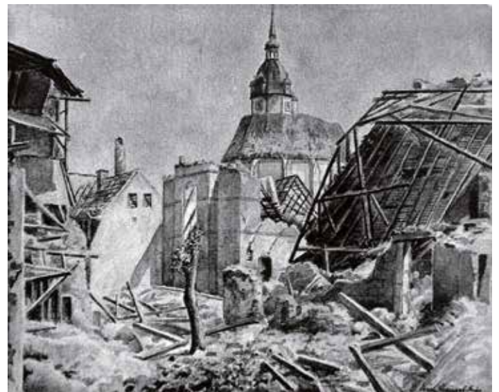
Naumburg nach dem Bombenangriff 1945. Nach einem Gemälde von Erich Menzel. Blick von der Neustraße in Richtung St. Wenzel

Mittlerweile waren auch Nachbarn zusammengekommen und halfen, die Balken, Mauersteinblöcke, Dachziegel, zerborstene Schränke... beiseitezuschaffen und die Angehörigen aus dem Keller zu befreien. Als meine Mutter draußen zurückschaute, traf sie ein Schock: Die Badewanne aus dem ersten Stock lag über dem Kelleraufgang, voll mit Schutt, Dachbalken... - aber das Überlaufrohr hatte sich in ein Balkenteil verhakt. Dadurch war ein schmaler Spalt entstanden, durch den sie, mein Bruder und die Tante gezogen werden konnten. Ohne das metallene Überlaufrohr wäre die Badewanne abgesackt und ein Ersticken aller im Keller möglich gewesen.